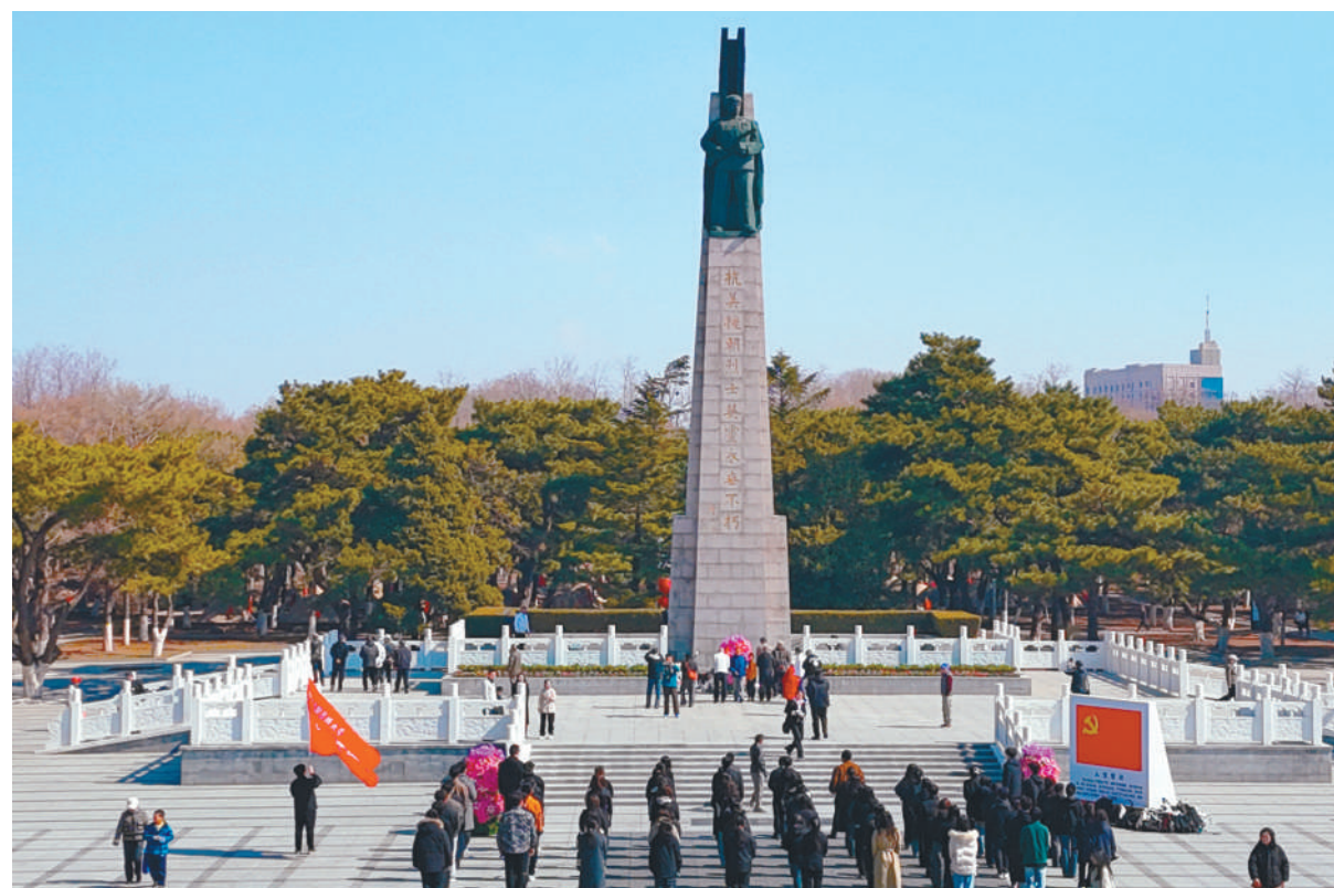
4月4日,在沈阳抗美援朝烈士陵园,各界群众怀着崇敬的心情致敬英烈。

游客们纷纷驻足聆听,对志愿者的宣讲表示认可和支持,不少人还主动索要宣传资料,表示会将文明旅游的理念传递给身边的人。此次活动不仅提升了游客的文明旅游意识,也为沈阳新乐遗址博物馆营造了更加和谐、文明的参观环境。